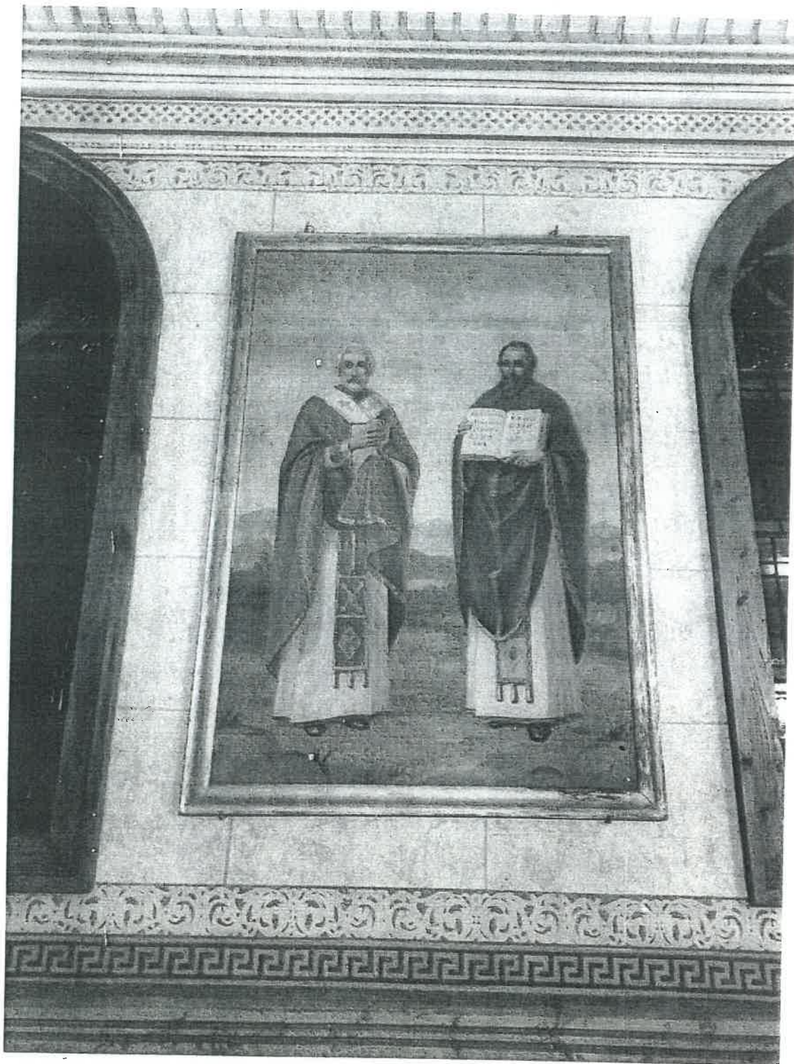
Obraz z przedstawieniem św. Cyryla i Metodego