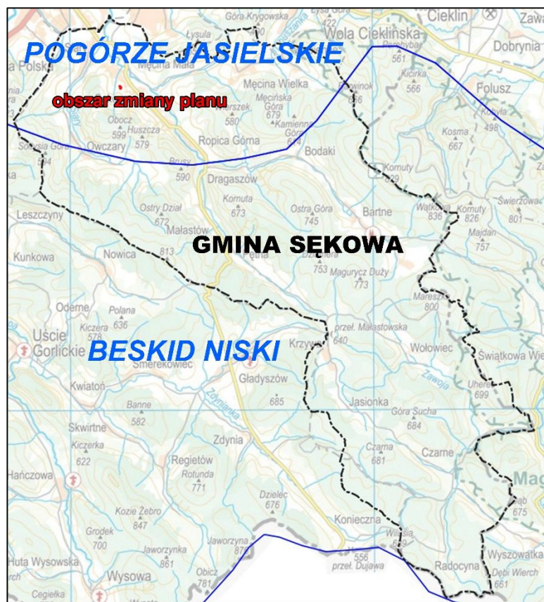
Ryc. 3. Położenie Gminy Sękowa oraz obszaru zmiany planu względem jednostek fizycznogeograficznych wg Kondrackiego