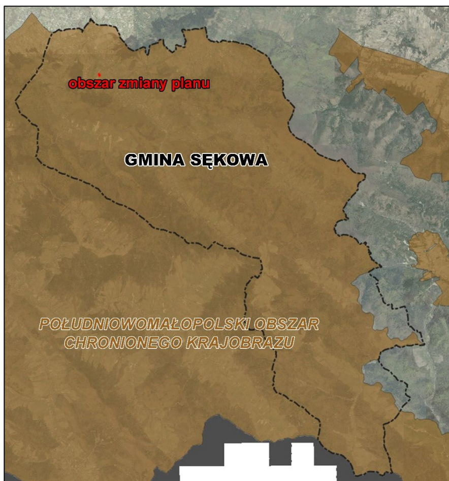
Ryc.6. Obszar Gminy Sękowa oraz obszar objęty projektem zmiany planu względem Południowomałopolskiego Obszaru Chronionego Krajobrazu

Południowomałopolski Obszar Chronionego Krajobrazu został utworzony na mocy Rozporządzenia Nr 27 Woj. Nowosądeckiego z 1 października 1997 r. (Dz. Urz. Woj. Now. Z 1997 r. Nr 43/97 poz. 147). Natomiast aktualnym Rozporządzeniem odnoszącym się do powyższego OChK jest uchwała Nr XX/274/20 Sejmiku Woj. Małopolskiego z dnia 27 kwietnia 2020 r. (Dz. Urz. Woj. Małop. Z 2020 r., poz. 3482). Obszar zajmuje powierzchnię 364 480,09 ha. Jego funkcja ochronna wynika z wybitnej wartości obiektów przyrodniczych, dla których OChK jest bezpośrednią otuliną lub dodatkową strefą ochronną (przejściową), a ponadto większą część tego terenu stanowi obszar węzłów i korytarzy ekologicznych sieci ECONET-PL.