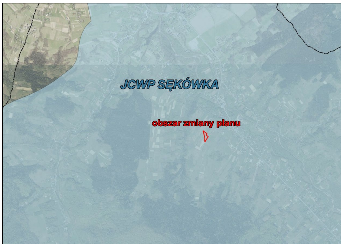
Ryc.5. Położenie obszaru objętego zmianą planu względem zlewni Jednolitych Części Wód Powierzchniowych

Wg podziału hydrologicznego obszar objęty niniejszym opracowaniem znajduje się w granicach scalonej części wód powierzchniowych SCWP GW0606 „Ropa od zb. Klimkówka do ujścia Sitniczanki”, w hydrologicznym regionie dorzecza Górnej Wisły – w obrębie jednolitej części wód powierzchniowych JCWP PLRW200012218269 „Sękówka”.