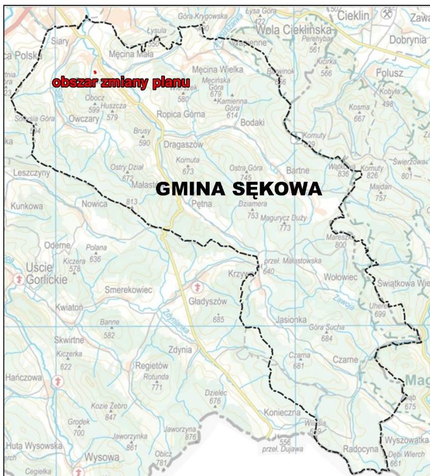
Ryc. 2. Położenie administracyjne obszaru opracowania

Projekt zmiany planu obejmuje teren położony w województwie małopolskim, powiecie gorlickim, w północnej części Gminy Sękowa. Dokładniej, przedmiotowy obszar obejmuje działkę ewidencyjną nr 2057 położoną we wsi Sękowa.