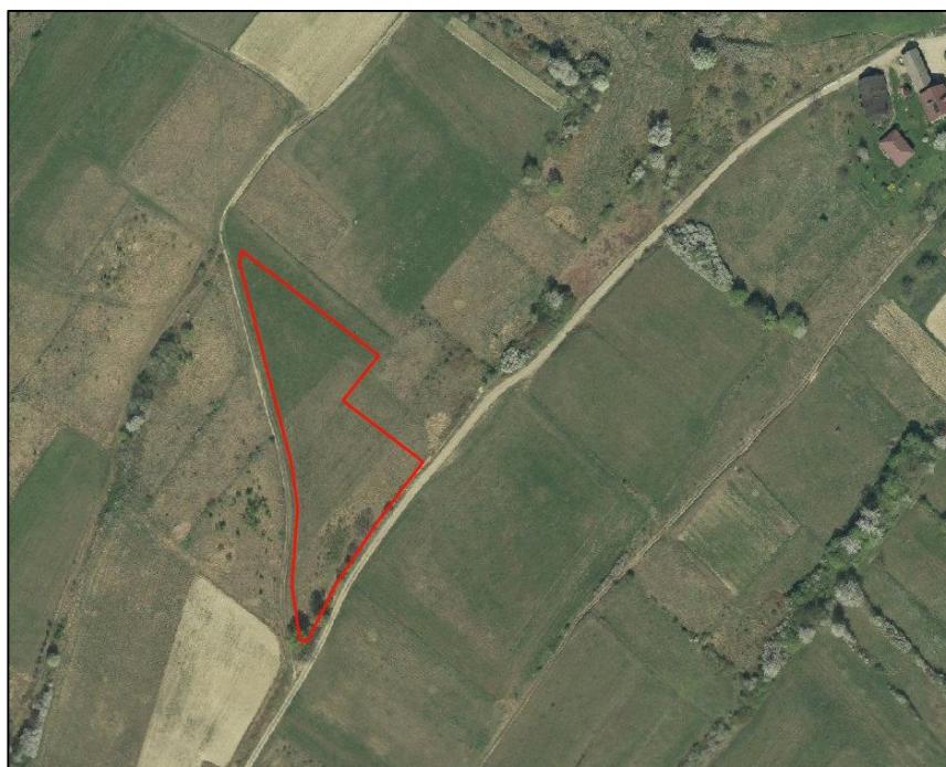
Ryc.6. Zagospodarowanie obszaru objętego zmianą planu na tle ortofotomapy

Przedmiotowy teren jest obecnie niezagospodarowany. Stanowi on otwarty teren użytków zielonych porośniętych niską roślinnością trawiastą regularnie koszoną. W południowej części terenu zlokalizowany jest niewielki pas zadrzewień i zakrzewień.