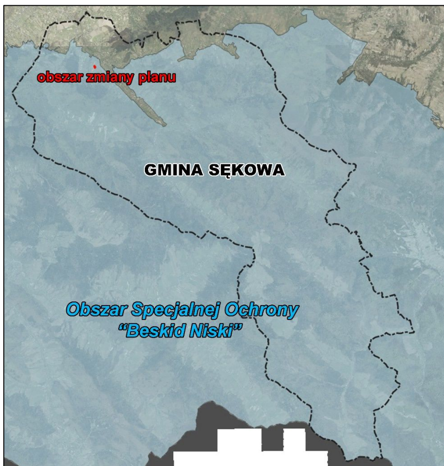
Ryc.7. Obszar Gminy Sękowa oraz obszar objęty projektem zmiany planu względem Obszaru Specjalnej Ochrony „Beskid Niski”

Obszar Specjalnej Ochrony „Beskid Niski” PLB180002 znajduje się w górach położonych w miejscu zwiężenia i największego obniżenia łuku karpackiego. Ich wysokość nie przekracza 1000 m n.p.m. Zachodnia część gór zbudowana jest z warstw jednostki magurskiej, gdzie w wielu miejscach na wierzchołkach wzniesień piaskowce tworzą skaliste formy. Wąskie pasma o stromych stokach i grzbietach twardzielcowych ciągną się względem siebie równolegle w kierunku NW-SE. Wschodnią część budują stromo ustawione fałdy i łuski dukielskie i tu głównym rysem rzeźby są wyniesione grzbiety (np. Cergowa Góra). Na stromych zboczach i w głębokich lejach źródłowych występują liczne rozległe osuwiska (najbardziej znane w Lipowicy koło Dukli). W Beskidzie Niskim znajdują się obszary źródliskowe Białej, Ropy, Wisłoki, Wisłoka, Jasiołki, które prowadząc swe wody ku północy płyną niekiedy obniżeniami równoległe do grzbietów lub przecinają je w poprzek głębokimi przełomami. Obficie występują wody mineralne. Roślinność układa się w dwa piętra: piętro pogórza - zajęte głównie przez pola uprawne, łąki, a tylko na niewielkich powierzchniach przez lasy grądowe - i piętro regla dolnego porośnięte buczyną i nasadzeniami świerkowymi.