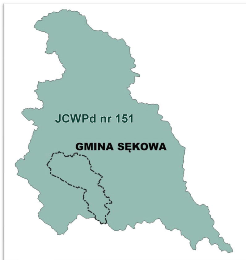
Ryc.4. Położenie Gminy Sękowa względem Jednolitej Części Wód Podziemnych Nr 151

Zgodnie z obowiązującym podziałem Polski na 172 Jednolite Części Wód Podziemnych, obszary opracowania zlokalizowane są w obrębie Jednolitej Części Wód Podziemnych: JCWPd nr 151 (Europejski kod PLGW 2000151).